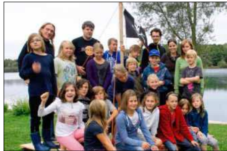
Achtung! Piraten enterten den Nimburger Baggersee: 21 Kinder und Betreuer hatten viel Spaß bei der Ortsranderholung der Kreisjugendarbeit.