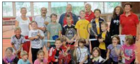
16 Kinder zwischen sechs und zwölf Jahren hatten mächtig Spaß beim buntem Ferienangebot des Tennisclubs Heimbach.

Programmspektrum mit einmaligem Besuch der Kinder auf dem Bauernhof reicht beispielsweise von der allgemeinen Hoferkundung, über Milch- und Getreideverarbeitung und Kräuterwerkstatt bis hin zu einer Veranstaltung zu Wildfrüchten. Aktuell läuft die Anmeldung zum Apfelprogramm; hier ernten und mosten die Kinder Äpfel. Fortlaufend und jahreszeit-